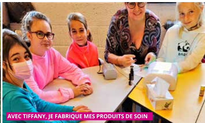
AVEC TIFFANY, JE FABRIQUE MES PRODUITS DE SOIN