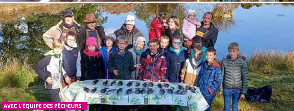
AVEC L'ÉQUIPE DES PÊCHEURS