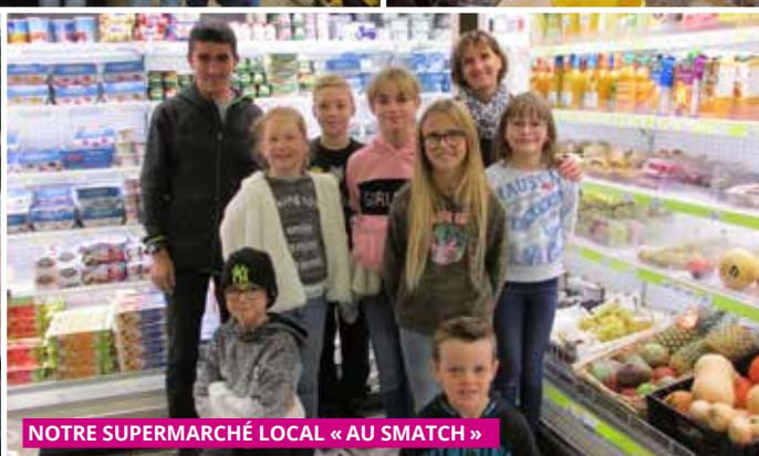
NOTRE SUPERMARCHÉ LOCAL « AU SMATCH »