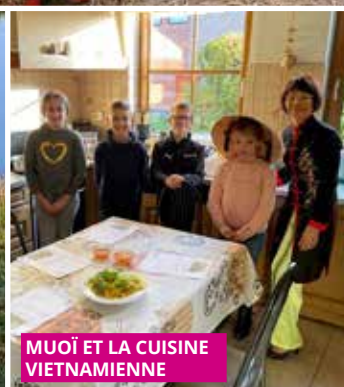
MUOÏ ET LA CUISINE VIETNAMIENNE