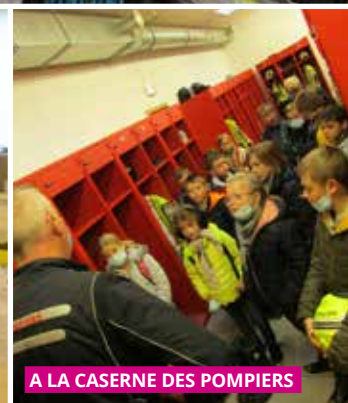
A LA CASERNE DES POMPIERS